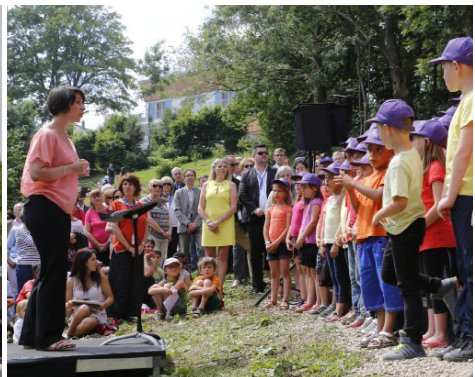
Ouverture de la Maison Messiaen en juillet 2016