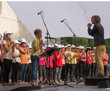
Ouverture du Festival Berlioz 2016